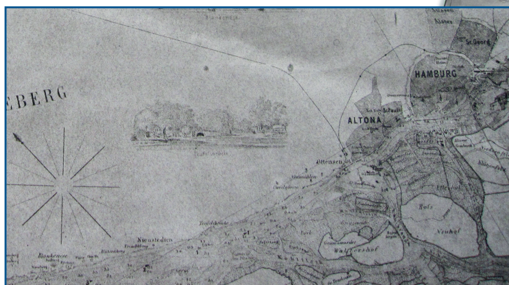
Älteste Karte im BSH Archiv: „Die Unterelbe, Hamburg bis Glückstadt“ von 1865