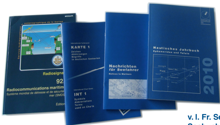
v. l. Fr. Seebuch, INT 1, Nachrichten für Seefahrer und Seebuch „Nautisches Jahrbuch“