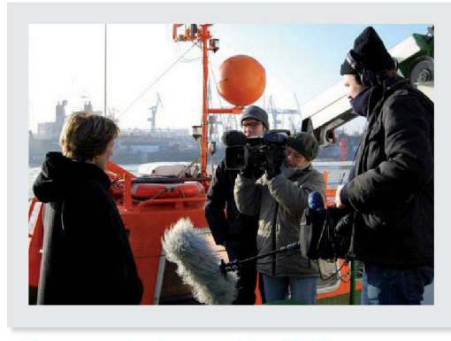
Jahrespressekonferenz auf der ATAIR

Chinese delegation of the State Ocean Administration visits BSH Hamburg