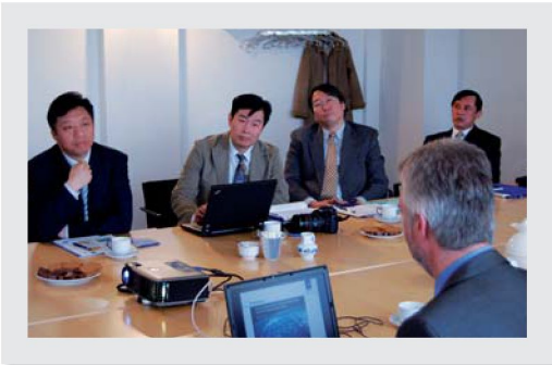
Chinesische Delegation der State Ocean Administration zu Besuch im BSH Hamburg